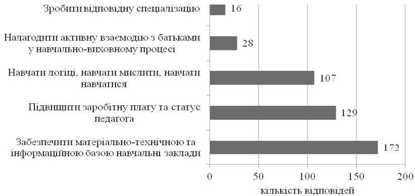
Рис. 2. Відповіді респондентів на запитання: “Що, на Вашу думку, потрібно зробити у першу чергу для забезпечення якості освіти?”

Зрозуміло, що якість освіти та освітньої діяльності залежить від багатьох чинників. Із запропонованих першочергових заходів, які б надали можливість покращити стан забезпечення якості освіти, респонденти на перше місце поставили забезпечення навчальних закладів належною матеріально-технічною та інформаційною базою, а також вказали на необхідність підвищити заробітну плату та статус педагога (рис. 2). Зауважимо, що саме необхідність підвищення рівня матеріально-технічного забезпечення навчального закладу респонденти визначили як головну пропозицію щодо підвищення якості освіти.