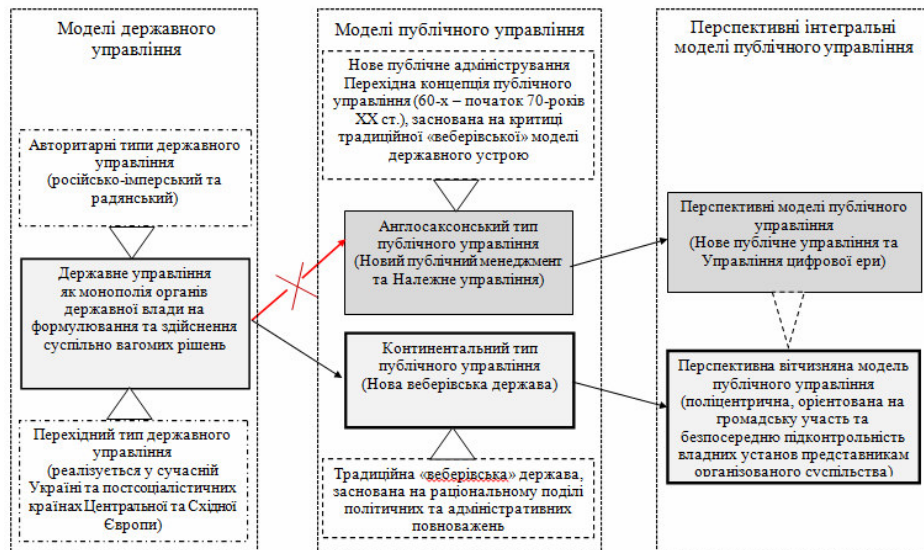
Рис. 3. Історичні та логічні етапи модернізації системи вітчизняного державного управління

Наочний огляд історичних та логічних етапів модернізації вітчизняної системи державного управління, наданий на рис. 3, демонструє сутність наших висновків.