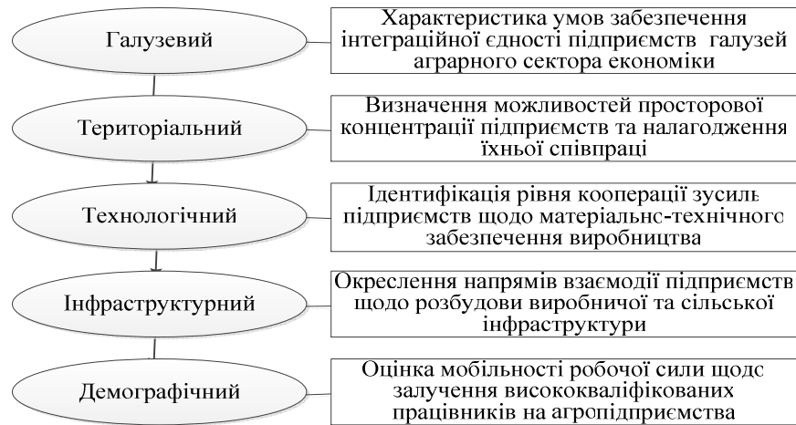
Рис. 2. Структурні зрізи інституціонального середовища в аграрному секторі економіки України

виробниками аграрної продукції, незахищеність інтересів останніх, що спричиняє недосконалість вітчизняного конкурентного середовища та знижує їхню мотивацію до здійснення економічної діяльності; недостатнє використання потенціалу сільськогосподарського корпоративного сектора господарювання, у результаті чого приділяється значно меншої уваги розбудові галузевої інфраструктури; неефективність державного впливу на механізми управління трансакційними витратами як на мікро-, так і на макрорівні, що спричиняє формування тіньового аграрного сектора; відсутність комплексного бачення взаємодії органів виконавчої влади та органів місцевого самоврядування щодо розвитку місцевого інституціонального середовища, що знижує продуктивність аграрного сектора в цілому, тощо.