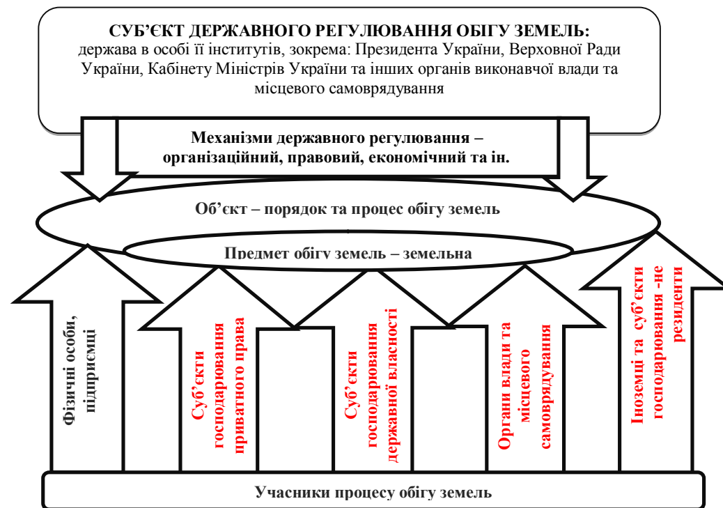
Рис. 1. Система державного регулювання обігу земель в Україні

управління, що створюють основу державного регулювання й забезпечують досягнення цілей управління в системі обігу земель.