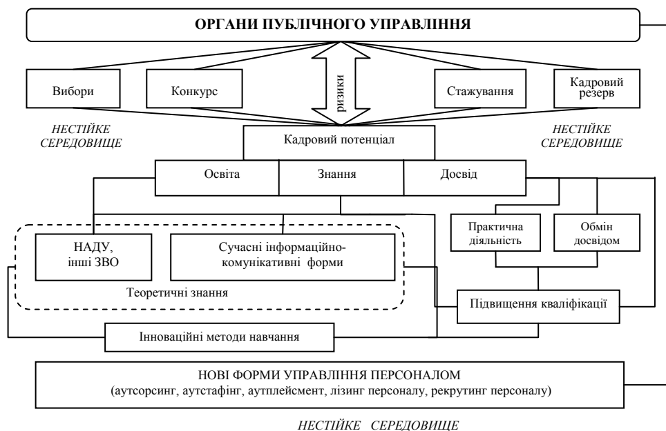
Рис. 2. Механізм інформаційно-кадрового забезпечення інноваційного розвитку територій: ЗВО – заклади вищої освіти

За результатами проведеного дослідження всю інформацію, на підставі якої повинен проводитися сьогодні контроль діяльності приватного партнера у сфері здійснення державно-приватного партнерства (далі – ДПП), систематизовано за такими напрямками контролю: економічний, фінансовий, адміністративно-фінансовий, виробничо-технічний, майновий, екологічний, законодавчий, соціально-трудовий, мобілізаційний. Запропоновано доповнити таку інформацію показниками, що дають повну та достовірну картину про стан відповідного об'єкта, а також рівень надання послуг у процесі його використання (управління) приватним партнером, за такими напрямками контролю: економічний (щодо виконання Інвестиційної програми; виконання Плану заходів з використання амортизаційних відрахувань на поліпшення майна; обліку витрат із субсидій та пільг населенню), фінансовий (щодо видатків на страхування об'єкта концесії; видатків на ліквідацію комунального підприємства), адміністративно-фінансовий (щодо погашення кредиторської заборгованості об'єкта концесії, зокрема перед бюджетами різного рівня, державними цільовими фондами), виробничо-технічний (контроль обсягів та якості послуг, що надаються приватним партнером відповідно до нормативів, норм, стандартів, порядків і правил, а також з урахуванням зміни потреб отримувачів послуг та їхньої кількості; обсягів