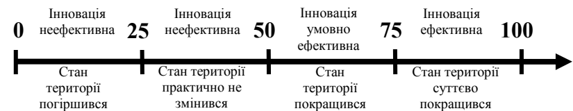
Рис. 3. Нормативний ряд оцінювання рівня конкурентоспроможності території внаслідок запровадження інновацій у життєдіяльність територіальних спільнот

Визначивши вплив інновації на рівень конкурентоспроможності території, можна оцінити ефективність її запровадження. Оцінка визначається шляхом експертного оцінювання цього впливу. На підставі максимально та мінімально можливих оцінок, які можна отримати від експертного опитування, формується нормативний інтервальний ряд, який наведено на рис. 3.