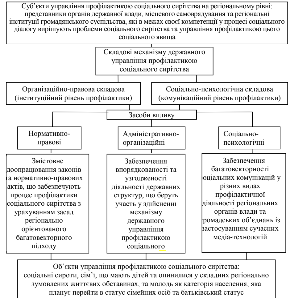
Рис. 1. Схема стратегічних пріоритетів удосконалення механізму державного управління профілактикою соціального сирітства на регіональному рівні

По-друге, адекватних змін потребує не тільки структура, а й методологія діяльності органів державної влади України, а саме: підтримка виховного потенціалу родини, раннє виявлення можливих криз та збереження родин, перехід від застосування каральних функцій відносно сім'ї до її всебічної підтримки й захисту. По-третє, потрібне налагодження дієвого діалогу органів державної влади і громадськості, який є необхідним для вдосконалення соціально-психологічної складової механізму державного управління профілактикою соціального сирітства. За таких умов можна забезпечити дієвість механізму державного управління профілактикою соціального сирітства.