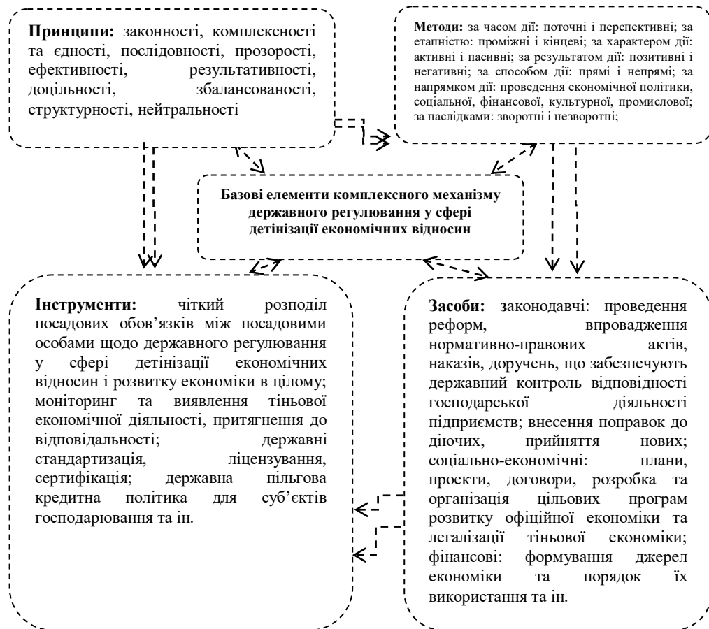
Рис. 1. Базові елементи комплексного механізму державного регулювання у сфері детінізації економічних відносин

регулювання, що було вжито державою останнім часом щодо виводу тіньових економічних процесів у легальну сферу, не були достатньо дієвими, не носили системного та комплексного характеру. З'явилися і поширюються нові тенденції у розвитку сфери тіньової господарської діяльності.