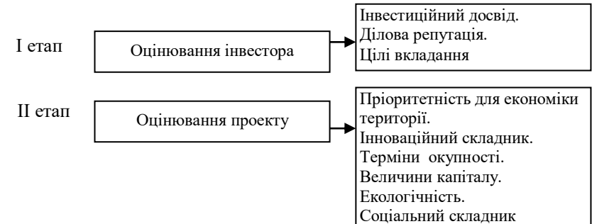
Рис. 2. Складники оцінювання якості іноземних інвестицій

варто провести оцінювання інвестора. Це означає, що необхідно оцінювати мету та цілі його інвестиційної діяльності а також його інвестиційну, ділову та економічну репутацію. Другий етап розпочинається з оцінювання інвестиційного проекту, пріоритетності для економічного розвитку територіальної громади, рівня інноваційності, екологічності, термінів окупності, величини інвестицій тощо.