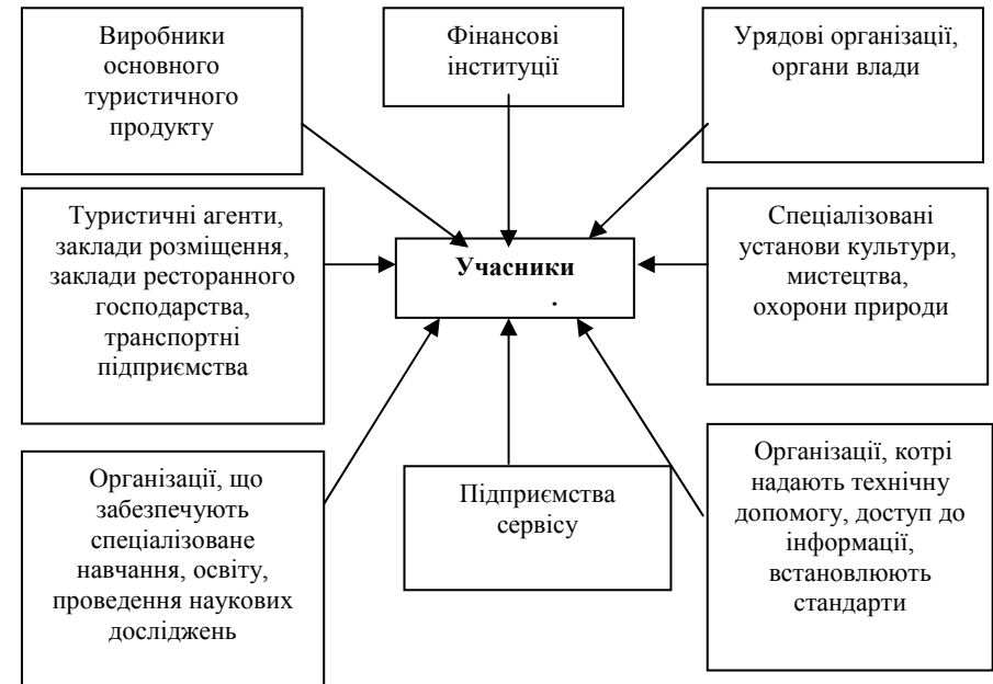
Рис.3. Складові елементи кластеру моделі сільського зеленого туризму

В умовах глобалізації застосування кластерних моделей у сфері сільського зеленого туризму дозволяє використовувати можливості природного потенціалу та трудового потенціалу для прискорення розвитку економіки України та відновлення її здатності надавати конкурентоспроможні послуги у сфері сільського зеленого туризму. Ринковий механізм через створення кластерів сільського зеленого туризму сприятиме взаємним узгодженням економічних, технологічних та соціальних параметрів інноваційного і туристичного зростання. Отож, за таких умов кластерна модель стане найбільш ефективним ринковим механізмом прискорення сучасного економічного розвитку.