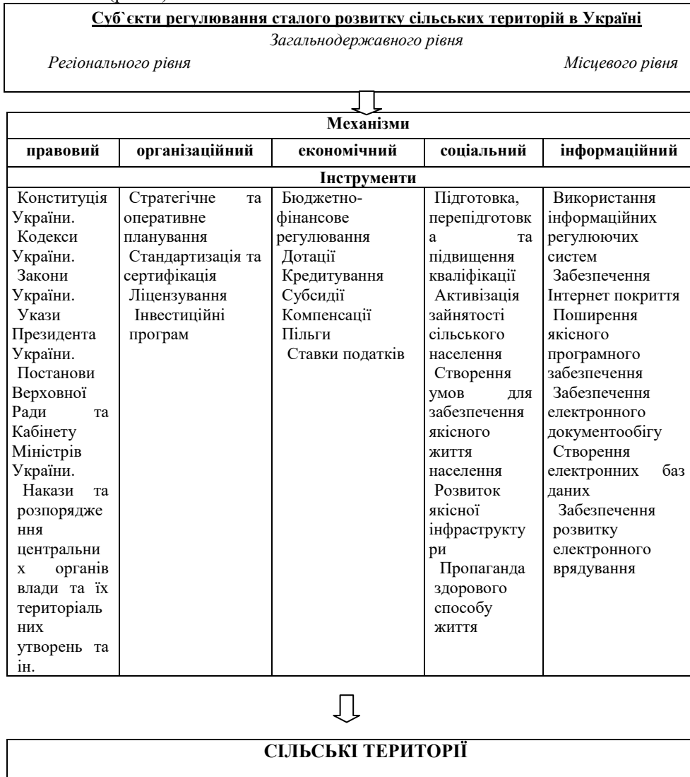
Рис. 1. Механізми державної політики сталого розвитку сільських територій

регулюючі дії Уряду в межах економічного, соціального та інформаційного механізмів (рис. 1).