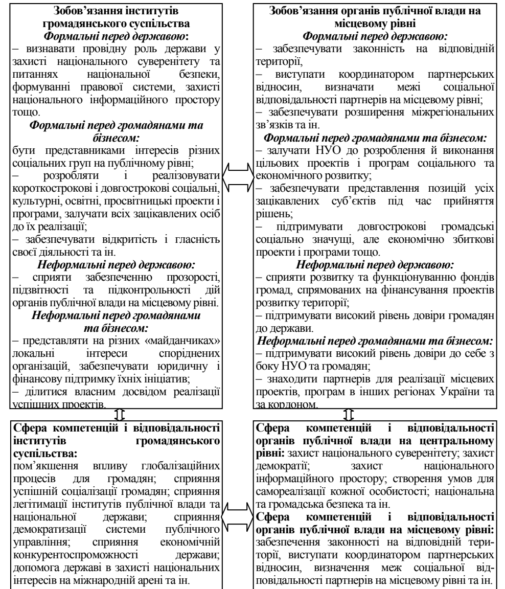
Рис. 2. Механізм взаємодії органів публічної влади з інститутами громадянського суспільства в умовах глобалізації

умовах глобалізації можна вважати механізм, що заснований на розподілі сфер компетенцій і відповідальності між ними (рис. 2).